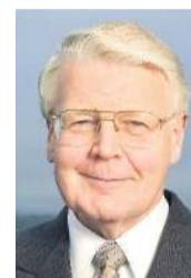
Ólafur Ragnar Grímsson

„Það verða engar ráðstefnur eða þing á okkar vegum fyrr en í haust,“ sagði Ólafur Ragnar. Næsti vettvangur á vegum Hringborðs norðurslóða – Arctic Circle verður á Grænlandi í lok ágúst í samvinnu við grænensku stjórnvöld. Svo verður þing Hringborðs norðurslóða – Arctic Circle haldið í október.